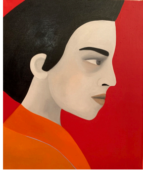
Inigo Ínigo 2022 Oil on Linen Óleo sobre lino 65 x 55 cm 25 5/8 x 21 5/8 in Kristin Hjellegjerde Gallery