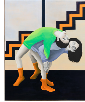
Carry me my friend Cárgame mi amigo 2024 Oil on Linen Óleo sobre lino 200 x 168 cm 78 3/4 x 66 1/8 in Kristin Hjellegjerde Gallery