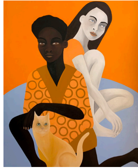
While the world goes round Mientras el mundo gira 2022 Oil on Linen Óleo sobre lino 162 x 130.5 x cm 63 3/4 x 51 3/8 in Fundación AMMA