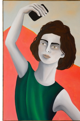
Self Obsession Obsesión conmigo mismo 2024 Oil on Linen Óleo sobre lino 100 x 65 cm 39 3/8 x 25 5/8 in Kristin Hjellegjerde Gallery