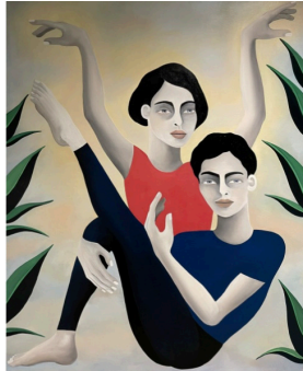
L'Arrivée La Llegada 2024 Oil on Linen Óleo sobre lino 162 x 130 cm Lara Sebdon Galerie