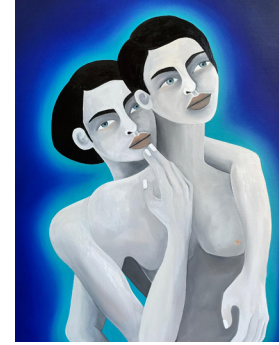
Les amours singulières Amores singulares 2024 Oil on Linen Óleo sobre lino 100 x 80 cm 39 3/8 x 31 1/2 in Kristin Hjellegjerde Gallery