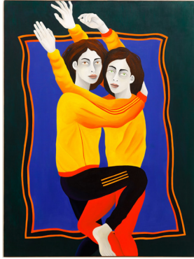
Echoes of Now Ecós del ahora 2024 Oil on Linen Óleo sobre lino 195 x 130 cm 76 3/4 x 51 1/8 in Kristin Hjellegjerde Gallery