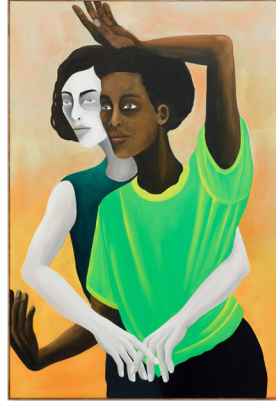
Only She Knows Sólo ella lo sabe 2024 Oil on Linen Óleo sobre lino 130 x 89 cm 51 1/8 x 35 in Kristin Hjellegjerde Gallery