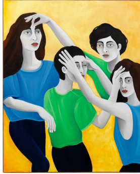
Mutual feelings Sentimientos mutuos 2024 Oil on Linen Óleo sobre lino 162 x 130 cm 63 3/4 x 51 1/8 in Kristin Hjellegjerde Gallery