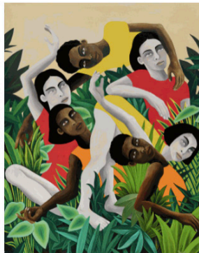
Dilemma Dilema 2024 Oil on Linen Óleo sobre lino 200 x 320 cm Lara Sebdon Galerie